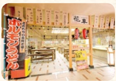
B級グルメマート(夜食処) 花車(店休日あり)

ホルモンうどんや蒜山風焼きそば等、B級グルメの宝庫岡山の食を一箇所で楽しみたいいただけます。