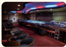
鉄道ジオラマルーム フロール

庭園を望む落ち着いた雰囲気ティーラウンジで、ゆっくりとした時間をお過ごしください。