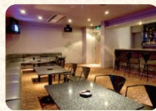
カラオケスナック ペシェ

岡山の特産品や当館オリジナルの商品を約300種類、取り揃えております。ぜひお立ち寄りください。