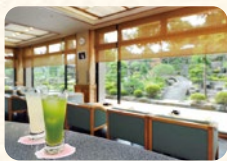
ティーラウンジ 花ごころ

ホルモンうどんや蒜山風焼きそば等、B級グルメの宝庫岡山の食を一箇所で楽しみたいいただけます。